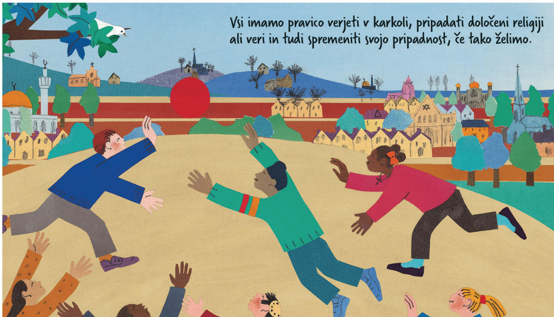
Umetnica: Jessica Souhami

Vsi imamo pravico verjeti v karkoli, pripadati določeni religiji ali veri in tudi spremeniti svojo pripadnost, če tako želimo.