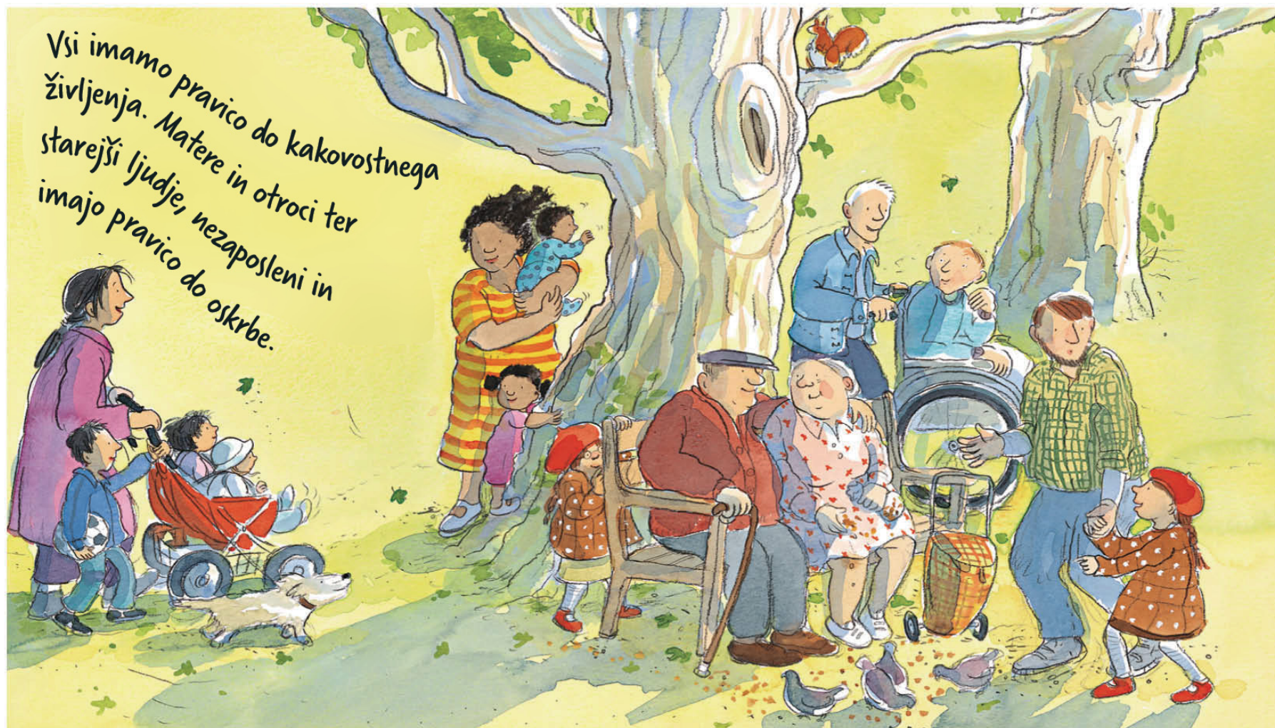
Umetnica: Brita Granström