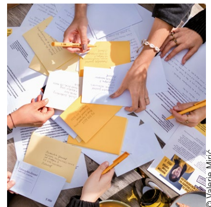
Pišem za pravice 2023 na Češkem.

DOVOLJ PROSTORA za čustveno vključenost in razvoj lastnega mnenja.