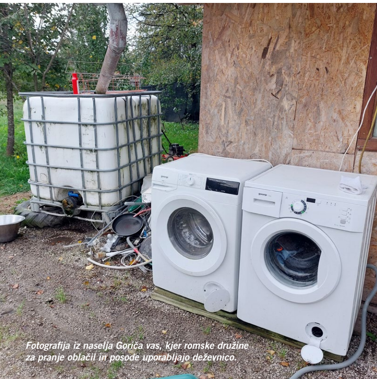
Fotografija iz naselja Goriča vas, kjer romske družine za pranje oblačil in posode uporabljajo deževnico.

#vodazavse #Pisemzapravice in označite @amnesty.slovenije.