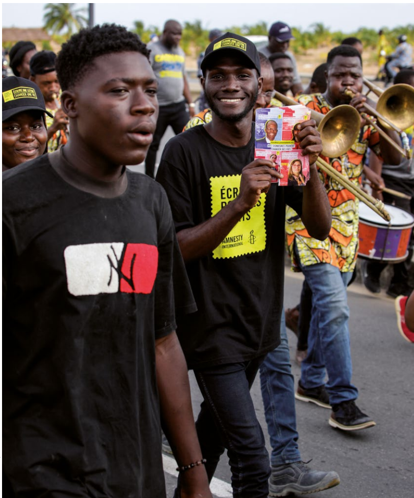
Dogodek Pišem za pravice v Beninu leta 2023.

Človekove pravice niso privilegij, ki bi ga spoštovali le, če to dopuščajo okoliščine.