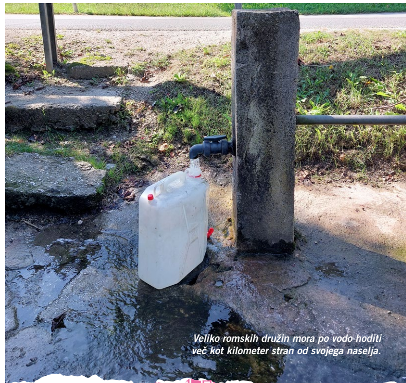
Veliko romskih družin mora po vodo hoditi več kot kilometer stran od svojega naselja.