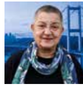
ŞEBNEM KORUR FINCANCI TURČIJA