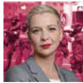
MARYIA KALESNIKAVA BELORUSIJA