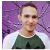
OQBA HASHAD EGIPT