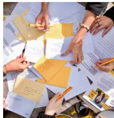
Pišem za pravice 2023 na Češkem.

DOVOLJ PROSTORA za čustveno vključenost in razvoj lastnega mnenja.