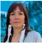
WET'SUWET'EN NATION LAND DEFENDERS KANADA

Posamezniki_ce, za katere si prizadevamo v letošnji kampanji Pišem za pravice, prihajajo iz 10 različnih držav z vsega sveta. S sodelovanjem v kampanji lahko pokažete, da geografija ni ovira za solidarnost. Štiri bomo podrobneje spoznali.